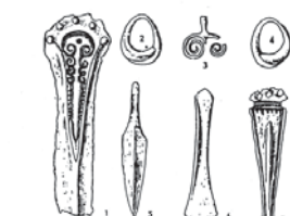
Bronzové výrobky otomanskej kultúry z Barce 1, 7 - zdobené bronzové dýky, 2, 4 - albínske náušnice, 3 - ardcový prívesok, 5 - bronzový nôž, 6 - bronzová sekerka